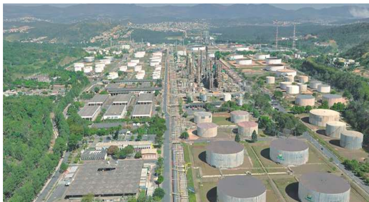
Figura 3: Refinaria Gabriel Passos – REGAP.

A REGAP, como é conhecida a Refinaria, pertence à Petrobras, portanto, uma indústria estatal, que fica no Estado de Minas Gerais, mais precisamente na divisa dos municípios de Betim e Ibirité. Ela também é uma das mais antigas, inaugurada em 1968, recebendo em 1982 seu primeiro investimento de ampliação, cujo aumento de sua estrutura para processamento mais que duplicou. Em 1994 resolveu fazer outro investimento, na instalação de uma unidade de coque, se tornando a segunda refinaria estatal a fazer isso. Além da produção de coque, a REGAP também produz gasolina, óleo diesel, GLP, asfalto, enxofre e aguarrás. Sua estrutura física ocupa uma área de 12,5 km 2 , cuja capacidade de instalação é de 115mbb/d, com isso, sua produção representa 8% da produção de refino realizado no país.