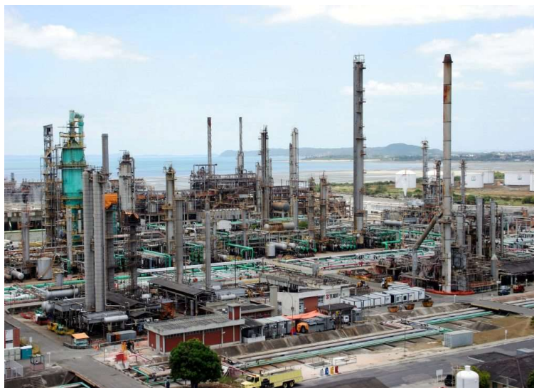
Figura 2: da Refinaria Presidente Bernardes – RPBC.

A RPBC possui uma grande estação de tratamento de efluentes, dada a própria capacidade dela de processamento por dia de barris de petróleo. Em razão de sua capacidade de processamento o tamanho da estação é justificado, uma vez que ela recebe os mais variados tipos de efluentes, o que implica em uma variação na composição dos dejetos oriundos deste processo. Como é esperado, todo e qualquer tipo de despejo industrial precisa passar pelas estações de tratamento antes de serem lançados ao seu destino final, que no caso é o Rio Cubatão.