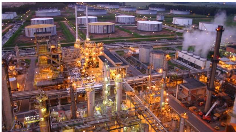
Figura 1: Refinaria Henrique Lages – RAVAP.

No tocante ao tema, a Refinaria Henrique Lage (REVAP), localizada na Rodovia Presidente Dutra, no município de São José dos Campos, na região do Vale do Paraíba, investiu na construção de uma ETDI com dimensão para realizar o tratamento de uma vazão correspondente a 705 m 3 /h dos efluentes produzidos. Segundo Vanelli (2004), esta ETDI é bastante flexível quanto a absorção das variações produzidas de sua carga sem que haja comprometimento da qualidade final de seus efluentes a serem descartados. Tais resultados motivaram a Refinaria a investir na ampliação das instalações de seu parque de refino, o que implicou no aumento do consumo de água e produção de efluentes líquidos. Neste sentido, o autor ressalta a necessidade de serem reavaliados os impactos causados por tais modificações no desempenho da ETDI, assim como de outros elementos que venham influenciar negativamente na qualidade do efluente final a ser descartado no rio ou igarapé.