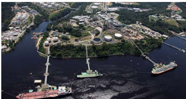
Figura 4: Refinaria ISAAC SABBÁ – REMAN.