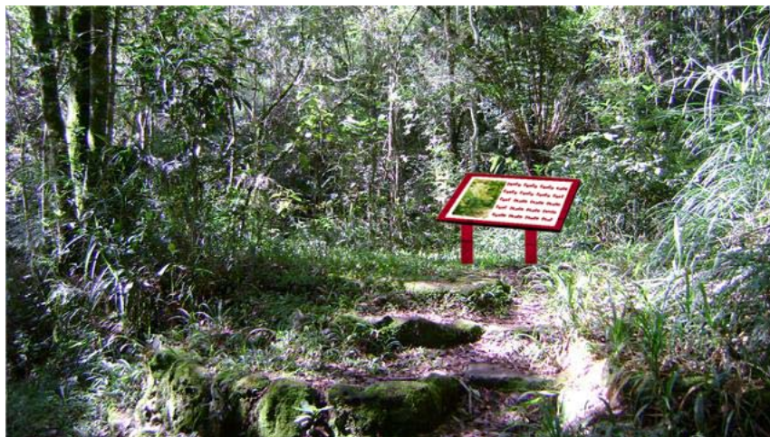
Figura 04 - Montagem da localização sugerida do Painel 04, Buraco do Padre - PR.

Painel 04: localizado também na parte da trilha principal (que dá acesso a cachoeira) onde é formado o bosque, contendo informação a respeito da fauna que pode ser encontrada na região.