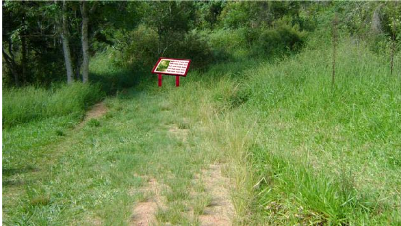
Figura 03 - Montagem da localização sugerida do Painel 03, Buraco do Padre - PR.

Painel 04: localizado também na parte da trilha principal (que dá acesso a cachoeira) onde é formado o bosque, contendo informação a respeito da fauna que pode ser encontrada na região.