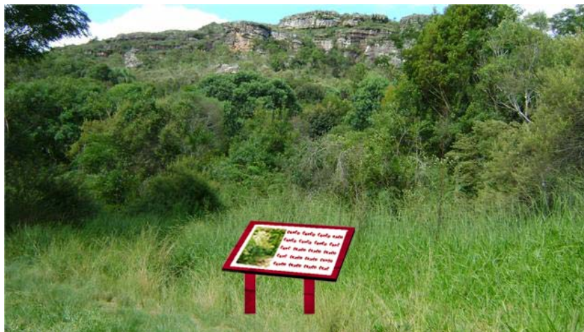
Figura 02 - Montagem da localização sugerida do Painel 02, Buraco do Padre - PR.

Painel 02: localizado na trilha principal junto ao início da trilha que dá acesso ao visitante até a parte superior da furna, com informação a respeito da geologia local e também disponível uma foto (imagem) da parte superior, pois, dessa forma poderá despertar curiosidade no visitante em ter acesso a esta vista da parte superior.