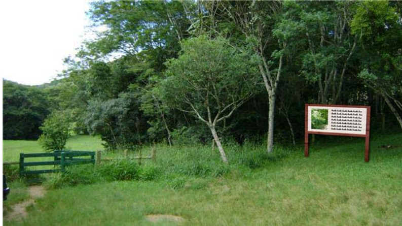
Figura 01 – Montagem da localização sugerida do Painel 01, Buraco do Padre - PR.

Painel 02: localizado na trilha principal junto ao início da trilha que dá acesso ao visitante até a parte superior da furna, com informação a respeito da geologia local e também disponível uma foto (imagem) da parte superior, pois, dessa forma poderá despertar curiosidade no visitante em ter acesso a esta vista da parte superior.