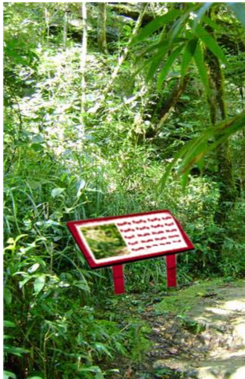
Figura 05 - Montagem da localização sugerida do Painel 05, Buraco do Padre - PR.

Já o texto sugerido para cada painel é apresentado abaixo: