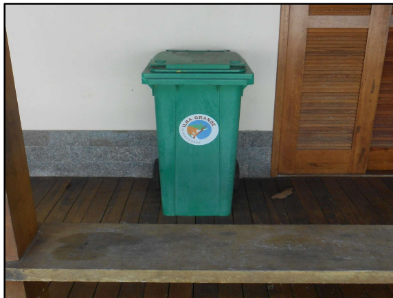
Figura 4: Lixeira com rodas na entrada da sede do INEA.

Durante a pesquisa de campo não foi observado na praia nenhuma lixeira ao longo da orla, entretanto, registrou-se uma pequena quantidade de resíduos ensacados na areia próximo de onde alguns turistas estavam reunidos (Figura 5).