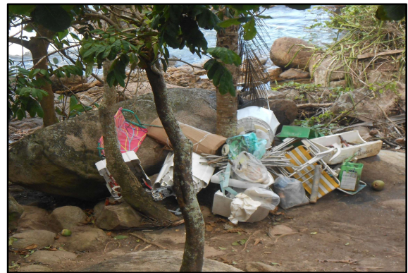
Figura 3: Materiais acumulados no terreno próximo ao cais.

A respeito da diferença na quantidade de resíduos gerados em alta e baixa temporada (pergunta 5), os entrevistados alegaram que pelo menos o triplo de resíduos é gerado na alta temporada. O morador 1 destacou que a coleta na alta temporada permanece a cada quinze dias (mesma frequência da baixa temporada), ocasionando um acúmulo de resíduos maior que a capacidade do barco da coleta pode transportar. O morador 3 explicou que normalmente o barco transportador dos resíduos passa em Aventureiro após já ter coletado de outras praias da Ilha Grande, sendo essa a última a ter os resíduos coletados, apontando ainda que “o Aventureiro é o segundo lugar mais procurado por turistas e pouco preocupado pela Prefeitura”. Embora os moradores entrevistados alegaram haver um aumento de três vezes mais lixo na alta temporada, dados do PMGIRS (2017) mostram que no período de baixa temporada gerou-se diariamente 129,13 kg de resíduos totais em Aventureiro e na alta temporada a geração diária foi de 175,36 kg de resíduos totais, isto é, um aumento de 46,23 kg, não sendo duas vezes mais.