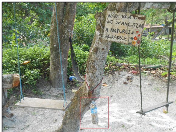
Figura 6: Garrafa PET com guimbas de cigarro.

Constatou-se, a partir da entrevista associada a formulário, que poucos moradores de Aventureiro praticam compostagem. Os entrevistados que separam os resíduos orgânicos disseram que esse resíduo tem três destinos diferentes na comunidade de Aventureiro: enterrado na floresta (moradores 1 e 3), usado para fertilizar hortas (moradoras 2 e 4) ou jogado no mar (morador 3). A moradora 4 disse que serve às vezes de alimento para os cachorros. Aqueles que possuem horta usam na terra para adubar suas plantações, como as moradoras 2 e 4.