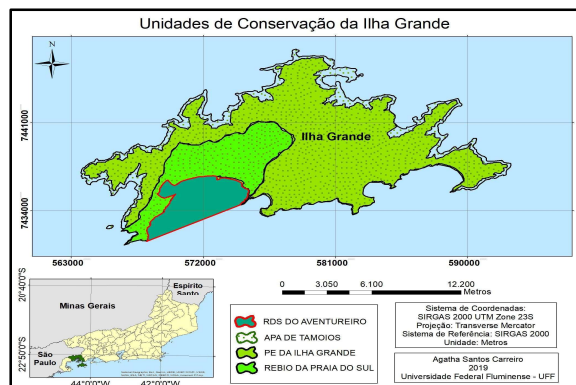
Figura 1: Mapa de localização das Unidades de Conservação da Ilha Grande.

Na Vila do Aventureiro em Ilha Grande o TBC é relevante para a comunidade caiçara que reside nesse local, pois complementa a renda por hospedagem em campings, sendo ela exclusiva organizadora do turismo recebido. E é exatamente pelo fato de ser a própria comunidade caiçara a beneficiária e produtora que o turismo em Aventureiro é considerado do segmento de base comunitária (COSTA et al., 2004). Considerando que a gestão dos resíduos está diretamente ligada ao fluxo turístico em ambientes explorados pela beleza preservada, como é o caso do turismo em UCs, é fundamental, proposições de ações por parte do poder público e da sociedade civil para amenizar os impactos e refinar a gestão dos impactos nas áreas litorâneas (SILVA, 2013).