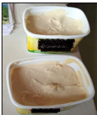
Figura 7: Sabão feito a partir de óleo usado.

acondicionamento e despejo de lixo da parte do INEA e/ou da Prefeitura de Angra dos Reis, sem especificar qual teria sido, já a moradora 2 respondeu que não recebeu orientação de nenhuma das partes. Embora tenha sido perceptível durante as entrevistas que eles têm consciência que devem armazenar os resíduos em recipientes ou sacos herméticos, o morador 3 alegou que lança às vezes resíduo orgânico ao mar.