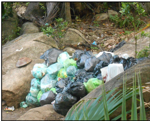
Figura 2: Resíduos acumulados no terreno próximo ao cais.

Constatou-se, a partir das respostas quanto à pergunta 4 (Quadro 2), que o manejo dos RS, após a implantação da coleta, é realizado pela própria população caiçara: cada morador de Aventureiro leva seu saco de lixo até o local de armazenamento (localizado próximo ao cais, como mostra as Figuras 2 e 3) em razão de não haver coleta de porta em porta. Os moradores 1, 2 e 4 fazem a triagem dos seus resíduos para fins de reuso, reciclagem ou compostagem. O transporte dos resíduos é realizado através de uma embarcação, sob responsabilidade da Prefeitura Municipal de Angra dos Reis, para área continental desse município, para sua transferência ao caminhão compactador que realizará o transporte terrestre até o aterro sanitário da CTR Costa Verde Ltda (PMGIRS, 2017). Ressalta-se que esse cais também é utilizado para os turistas acessarem a praia. A limpeza da faixa de areia, por sua vez, é realizada por moradores associados à Prefeitura de Angra e o descarte desses resíduos segue a orientação do INEA (informação das moradoras 2 e 4).