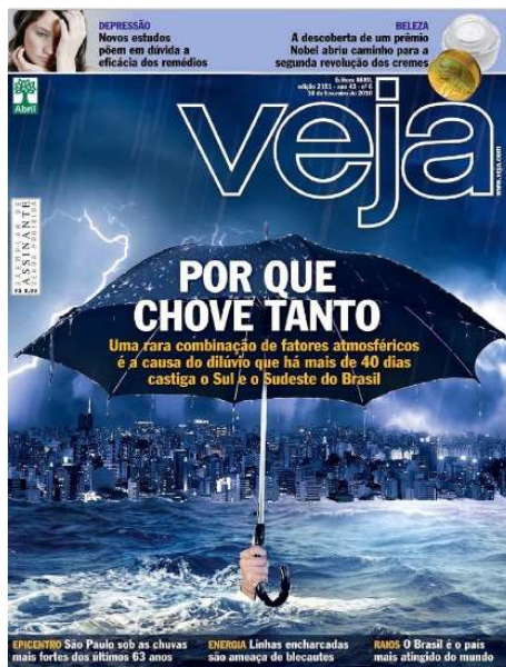
Figura 3: ‘Por que chove tanto’.

Além dos elementos centrais (verbais e não verbais) da capa, é interessante observar que a força dos enunciados (elementos textuais) contidos na nota de rodapé tem uma função secundária e complementar que ajuda a reforçar a causa da pergunta central (‘Por que chove tanto’), com dados e informações estatísticas e científicas, como: ‘ EPICENTRO: São Paulo sob as chuvas mais fortes dos últimos 63 anos ’, ‘ ENERGIA: Linhas encharcadas são ameaças de blecautes ’ e ‘ RAIOS: O Brasil é o país mais atingido do mundo ’, esses enunciados buscam atribuir, por meio da conteúdo científico, aos fenômenos naturais a culpa pelas catástrofes que aconteceram em cidades das Regiões Sul e Sudeste do país.