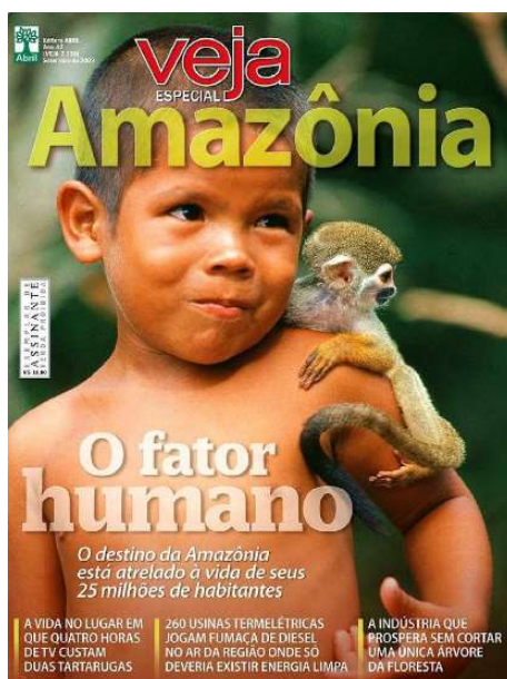
Figura 3: 'Amazônia'.

preservação e conservação da vida na Amazônia, apresentando uma visão de natureza de valor estético e espiritual, usando um discurso e simbologias de fontes sentimentalistas e culturais típicas dos movimentos de volta à natureza.