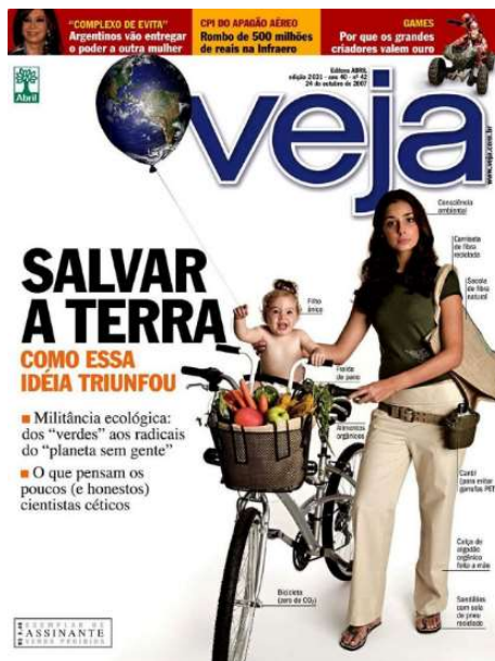
Figura 2: 'Salvar a Terra'.

e equilibrado para as presentes e futuras gerações, assim, salvar a terra para filhos, netos e descendentes, um projeto de futuro para que se possam usufruir de um mundo ecologicamente equilibrado e sustentável.