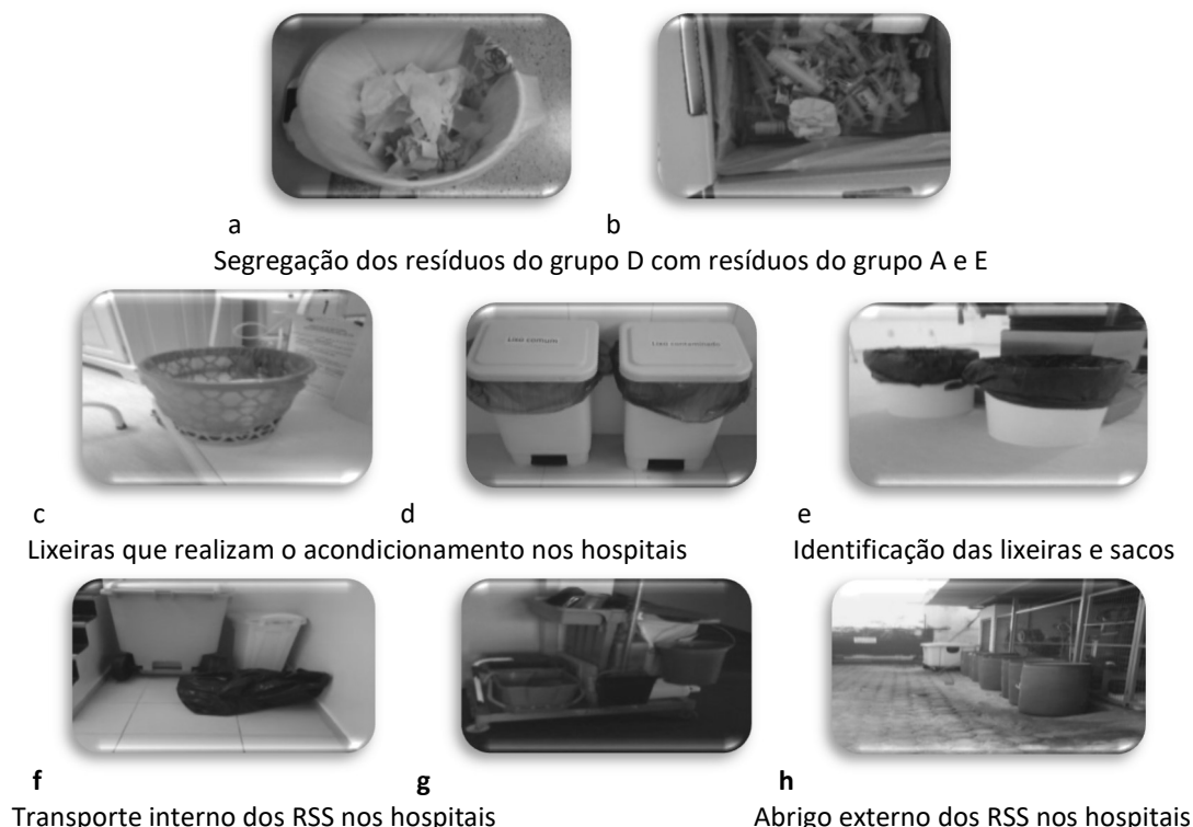
Figura 2: Manejo dos resíduos de serviços de saúde.

Conforme evidencia-se a figura 2 uma das principais dificuldades para realizar a segregação é a ausência de recipientes para os resíduos do grupo A, inexistência de sacos com cor estabelecidas pelas normas regulamentadoras conforme figura 2 imagem (c) e/ ou uma única cor de saco utilizado no estabelecimento ser o da cor preta conforme figura 2 imagem (d), bem como lixeiras quebradas que acarretam riscos ocupacionais pois o profissional precisa durante a rotina de trabalho abrir a lixeira para descartar RSS estando expostos a um possível tombamento da lixeira, como sacos e coletores não são identificados pelos símbolos padronizados conforme a imagem (e) da figura 2 e a ausência de coletores de resíduos para transporte interno e externo com identificação de símbolo biológico contribui diretamente para que a segregação ocorra de maneira inadequada.