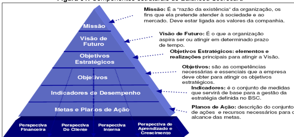
Figura 01: Componentes estruturais do Balanced Scorecard

O BSC é fundamentado na ideia de que o planejamento estratégico deve basear-se numa gestão que avalie mais do que simplesmente medidas financeiras isoladas, desconexas com os outros departamentos.